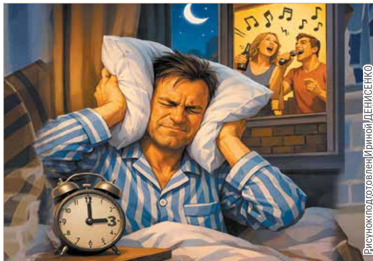
Рисунок подготовлен Ириной ДЕНИСЕНКО

ШУМ ОТ РАБОТАЮЩЕЙ НОЧЬЮ СТИРАЛЬНОЙ МАШИНЫ МОЖЕТ СЧИТАТЬСЯ НАРУШЕНИЕМ ЗАКОНА О ТИШИНЕ