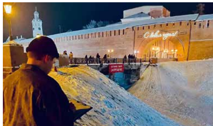
Запрет на катания в кремлёвском рве — мера вынужденная и необходимая.

Кроме того, Сергей Брюн уточнил, почему нельзя бросать