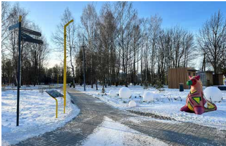
Ильинский парк замер в ожидании будущего лета и больших событий.