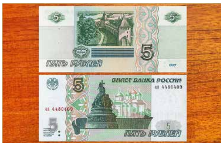
Пятирублёвые денежные купюры Банка России с изображением кремля, собора Святой Софии и памятника «Тысячеление России» в Великом Новгороде.

Майор, как и положено по законодательству, официально оформил показания продавщицы и изъятие денежных купюр и вскоре направился к дому, в котором проживал тот самый пьяница, что оставил в магазине в качестве средств платежа вместе с прочими