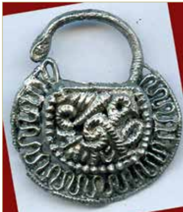
Колт (свинцово-оловянистый сплав), XII в., найден на Троицком раскопе в 2025 году. Красивая наука — археология!

— На самом деле новгородских конференций у нас три, есть ещё «Письменность и книжность», «Искусство и реставрация». Они, напомним, проходят с периодичностью через год. И только археология — это открытие каждого года. И каждый раз