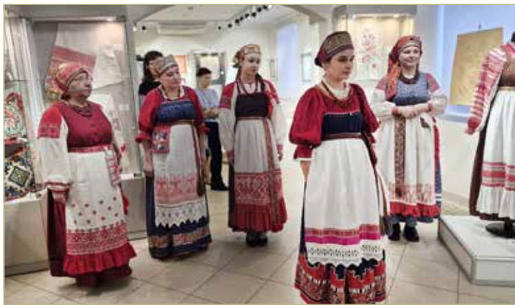
На открытии выставки было устроено дефиле мастериц в традиционных костюмах, украшенных вышивкой.

Важно не только бережно хранить работы, созданные почти 100 лет назад, но и переосмысливать наследие, оставленное нам прежними мастерами этого вида декоративно-прикладного искусства.